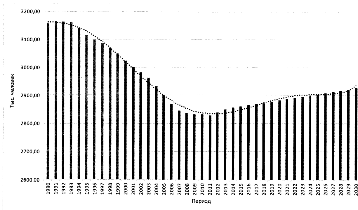
Рисунок 1. Динамика численности населения Красноярского края

В структуре населения будет увеличиваться доля населения младше и старше трудоспособного возраста, при снижении доли населения в трудоспособном возрасте. На этом фоне увеличится уровень демографической нагрузки на занятое население.